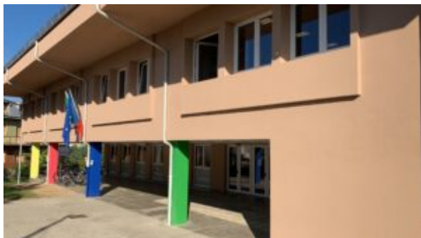
Scuola "F. MOCHI"