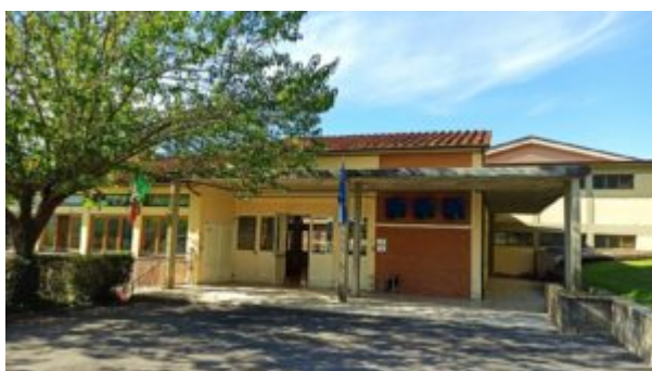
Scuola "E. FERMI"