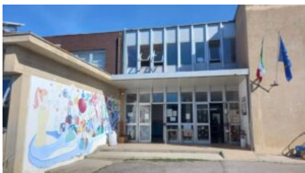
Scuola "M. HACK"